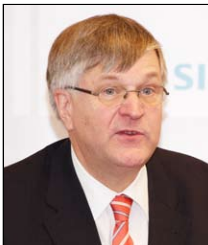
Staatssekretär Peter Hintze.

Die Republik Südafrika ist der größte deutsche Handelspartner in Afrika und außerhalb der EU der neuntwichtigste. Für Südafrika war wiederum